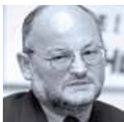
Dr. sc. Zlatko Mateša

PREDSJEDNIK HRVATSKOG OLIMPIJSKOG ODBORA CHAIRMAN OF CROATIAN OLYMPIC COMMITTEE